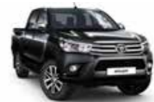
218 Чорний 2