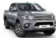
1D6 Сріблястий 2