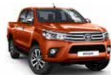
4R8 Оранжевий 2