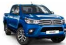
8X2 Блакитний 2

Вся інформація, представлена у цьому матеріалі, є точною та дійсною станом на дату публікації 18.08.2015.