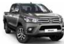
1G3 Сірий 2