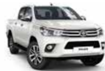
070 Білий перламутр 2