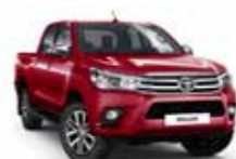
3T6 Червоний 2